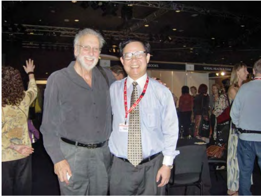
（左：欧洲性学会副会长Chiara Simonelli教授）

大会的主议题共 19 个。每个议题又有若干的分议题，分议题共 99 个。来自五大洲的性学专家发表了精彩的学术报告，充分反应了世界性学研究和性健康教育的最新动态。